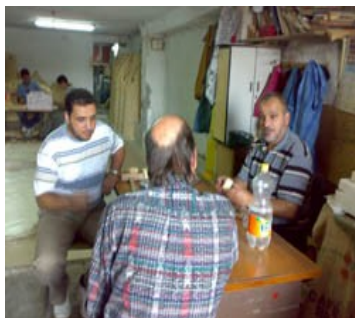
Les 3 partenaires: production, exportation et distribution (France)