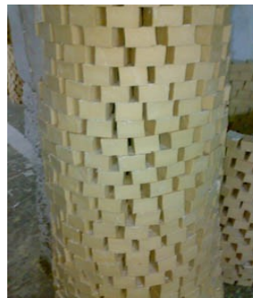
Séchage des savons