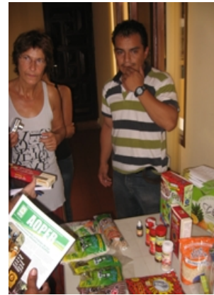
L'exposition (vues partielles) de produits boliviens et français