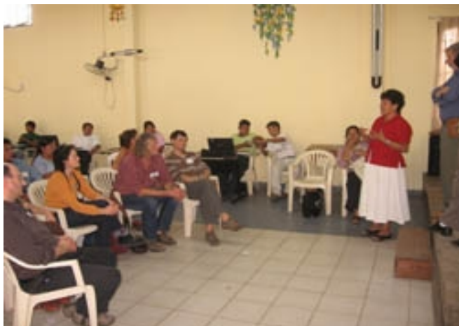
Accueil au CIDOB (Santa Cruz)