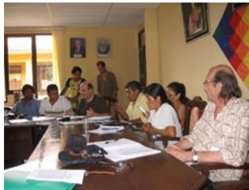
Echanges sur les coopératives et les coracas...