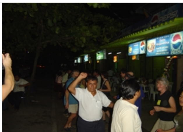
Un peu de détente ...dernier soir !