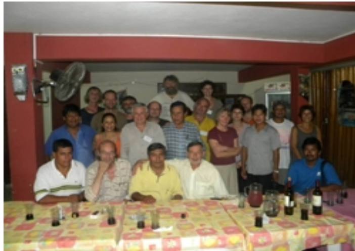
Une photo de famille