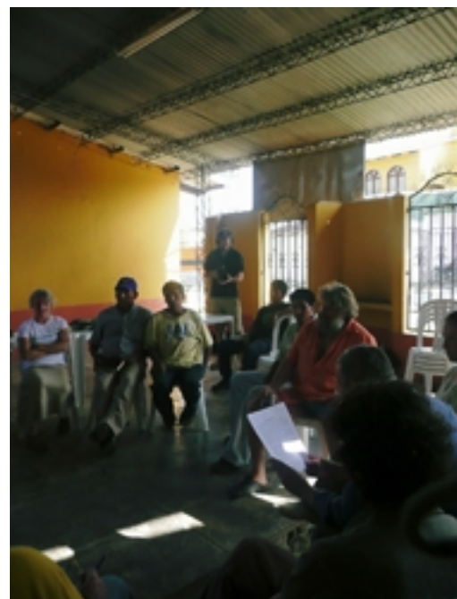
De retour à Yapacani