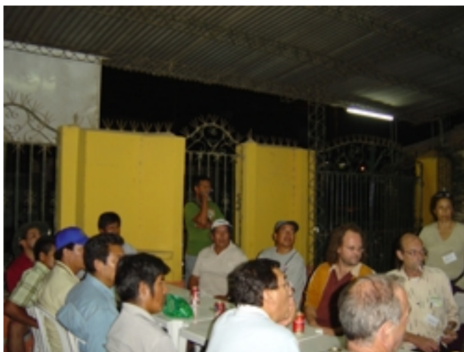
Accueil à Aspabri(Yapacaci)