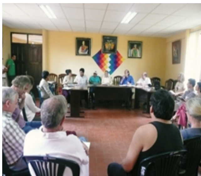
Réunions dans la Salle du Conseil municipal de Villa Tunari