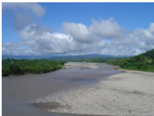
La région de Villa Tunari